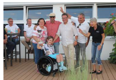
Sieger Morgan Teamwettbewerb