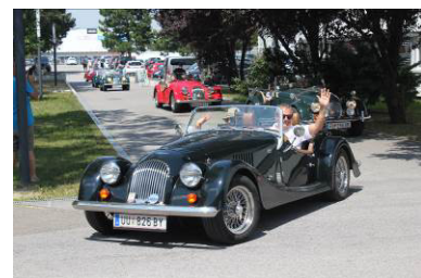
Morgan Club - MSCCA