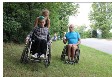
Übung im Gelände