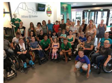
Allianz Stadion – SK Rapid